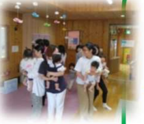
おやこでワクワク