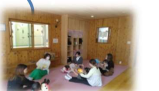
Let's enjoy English!

対象)おおむね2歳頃～ 講師)鈴木美子 先生より 『英語のうた、絵本の 読み語りなど。元気いっぱい 楽しく体を動かしながら いっしょに英語で遊びましょう!』